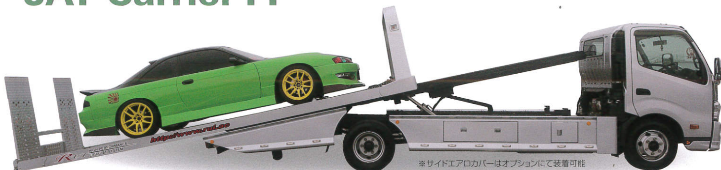
※サイドエアロカバーはオプションにて装着可能