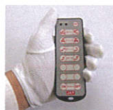
ラジコンで簡単に操作。 (オプション)

フレーム溶接構造のため、高強度・低床(クラス最小) 優れたメンテナンス性を実現!