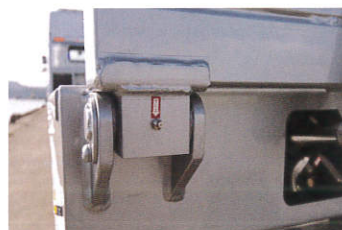
耐久性に優れたJATオリジナルBKT