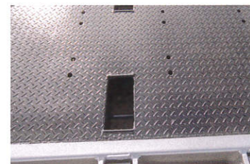
荷台後部 ウィンチワイヤー用埋込フック