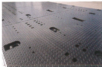
埋め込み式丸環フック(オプション)

フレーム溶接構造のため、高強度・低床(クラス最小) 優れたメンテナンス性を実現!