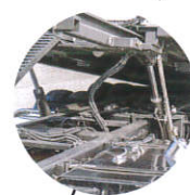
ツインシリンダーにより 安定感バツグン! (オプション) 【特許取得済み 第3145994号】