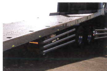
ランプ類(作業灯・マーカー)