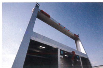
キズ防止アルミガード(オプション)